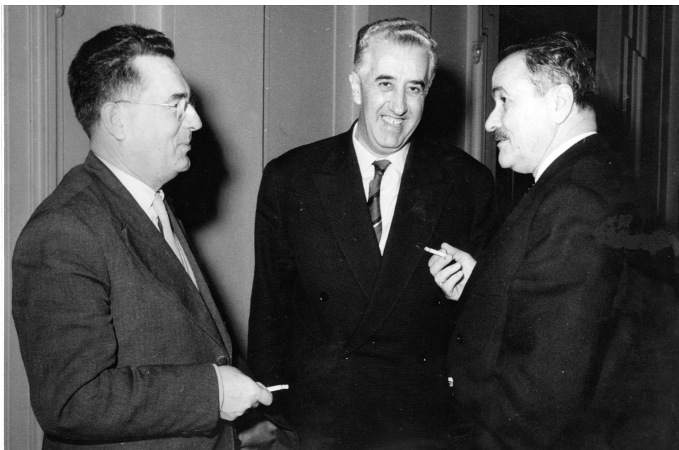
Ilustracija 2. Džemal Bijedić, sekretar SIV-a za zakonodavstvo, Beograd 1963.

je jedan dio kadrova do te mjere prakticistički postupao da nije bio sposoban da vidi najosnovnije političke probleme. Neki su potpuno potcjenjivali i partijsko članstvo i radnog čovjeka; razvijala se demagogija koja je radala, kako neki kažu, nove Mujage Komadine. Članstvo je smatralo da se mnoge stvari rješavaju uz prefarans u klubu privrednika, 'Veležu' i slično." U takvoj situaciji odluke su se donosile ne na redovnim sastancima, nego u druženjima u kafanama i slično.