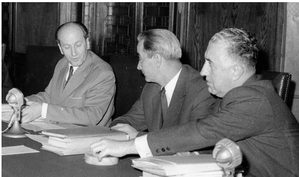
Ilustracija 3. Džemal Bijedić na sjednici Saveznog izvršnog vijeća, Beograd 9. decembra 1960.

ću, navodeći da su Bijediću predlagali "interni razgovor, za koga neće niko saznati." Bijedićevo odbijanje da pristane na takav način rada bilo je pokazatelj njegove političke zrelosti i političke odgovornosti.