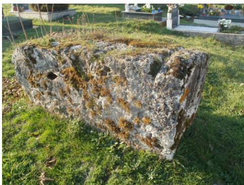
Stećak iz Ostružnice