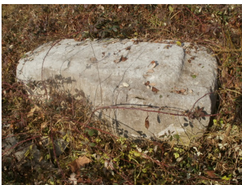
Stećak s motivom štita (Kiseljak)