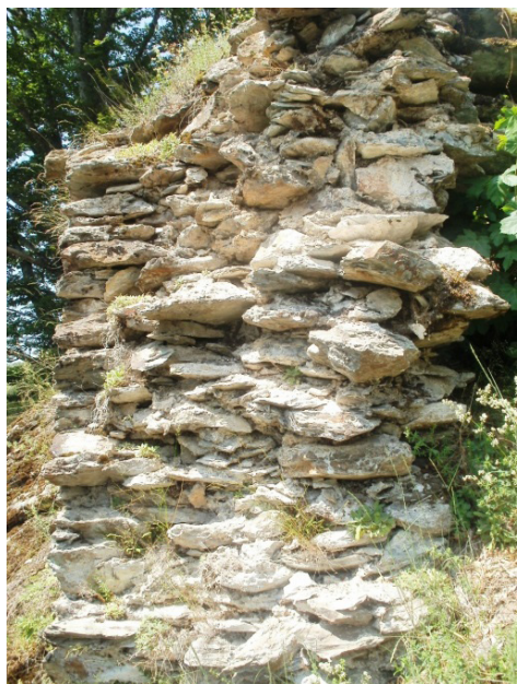
Ostatak bedema na Kozogradu