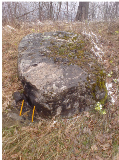
Stećak iz Podastinja