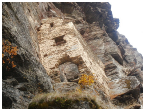
Kaštela (Bijeli grad)