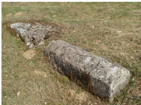
Stećci (Brdo kod Deževica)