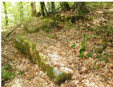
Stećci (Kruškova bašća)