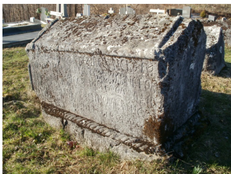
Radojev stećak (Zabrđe)