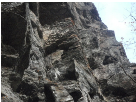
Kaštela (Crni grad)