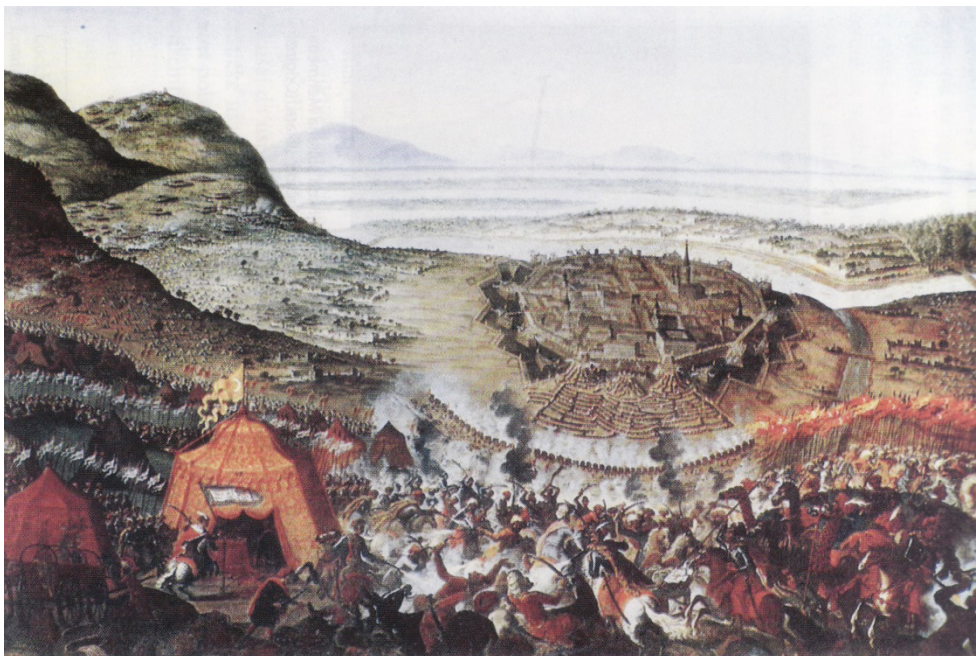
Borba na brdu Kalemberg 12. septembra 1683, original u: Museen der Stadt, Wien

Sobjeski. Ovo potvrđuje i Mikele Foskarini, prema kome se „12. septembra pojavilo hrišćansko znamenje na vidiku opsednutog grada”. 33