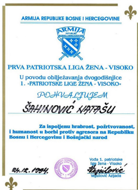
Slika 4 – Pohvala za Natašu Šahinović ispred Prve patriotske lige žena Visoko, 1994, Privatna dokumentacija porodice Šahinović.

obnaša funkciju rukovodica radne jedinice Zavičajnog muzeja. Od početka ratnih događaja 1992. u potpunosti se angažovala na spašavanju zbirki Zavičajnog muzeja i evidentiranju oštećenja na kulturno-historijskim spomenicima u Visokom i okolini. 13 Upravo je tokom ratne godine 1994. od 25. juna do 3. jula provela zaštitno arheološko istraživanje na Starom gradu Visoki. 14