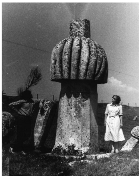
Slika 3 – Nataša Šahinović u Glamoču pored Bašića nišana, 1979, PAŠ.

Saletović” 5 Neophodno je naglasiti da je zbog manjka broja muzejskih uposlenika istovremeno obavljala funkciju kustosice i rukovodioca. 6 Dala je značajan doprinos na skupljanju, istraživanju i prezentaciji kulturno-historijskog naslijeđa nekadašnjeg centra srednjovjekovne Bosne. Krajnji rezultat njenog rada jesu katalogi raznih izložbi, muzejskih i galerijskih, stalnih i povremenih, brojni stručni materijali poput prikaza i članaka te predavanja. Radila je u arheološkim ekipama vrhunskih stručnjaka: Pavla Anđelića, Ive Bojanovskog i Đure Baslera. Pavao Anđelić Natašine terenske izvještaje sa samostalnih istraživanja i rekognosciranja uvrstio je kao punopravne stručne rezultate u svoje naučne radove. 7