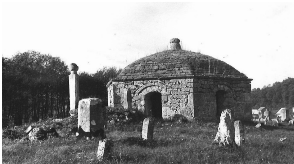
Slika 5 – Fotografisala Nataša Šahinović. Staro muslimansko groblje, Kopčić Polje, Bugojno, 1976, PAŠ.

Godine 1999. učestvuje u radionici kustosa pod nazivom “Muzeji i galerije savremene umjetnosti – nakon rata” u organizaciji Soros centra za savremenu umjetnost Zagreb i Soros centra za savremenu umjetnost Sarajevo. Jedan je od učesnika iz Bosne i Hercegovine ispred Zavoda za zaštitu spomenika. 27 Kao saradnik učestvuje u izradi dokumentacije za nominaciju Mostara na listi svjetske baštine. 28 Uzima učešće u stručnoj raspravi o radnom tekstu Zakona o kulturnom naslijeđu Bosne i Hercegovine, koja je održana 6. januara 2005. u zgradi institucija Bosne i Hercegovine u Sarajevu kao predstavnik Zavoda za zaštitu spomenika FBiH. 29 Kao stručna