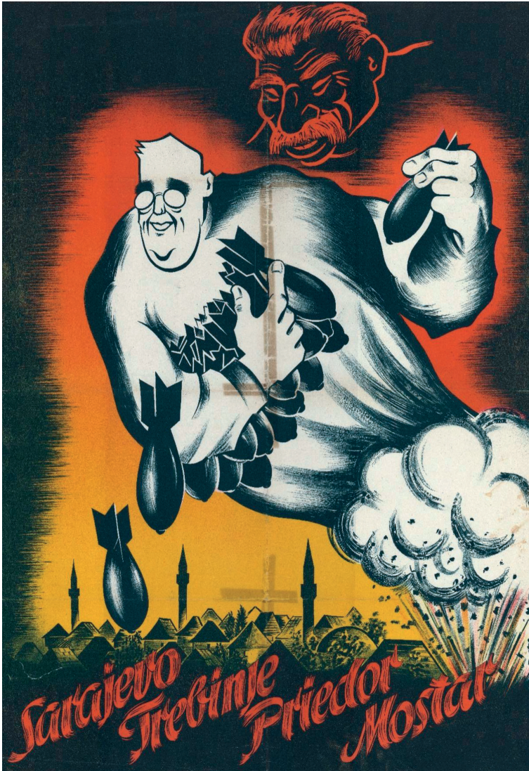
Slika 2 – Plakat.

Dan kasnije štampa donosi doradenu verziju razloga zbog kojih je bombardovano Sarajevo, a prema kojoj je ono trebalo biti podrška iz