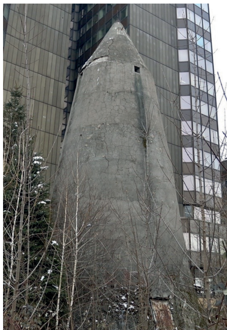
Slika 7 – Winkelov toranj u Sarajevu (Pofalići, u neposrednoj blizini zgrade “Energoinvesta”).

Izvor: Narodne novine , br. 208, 16. 9. 1942, 10.