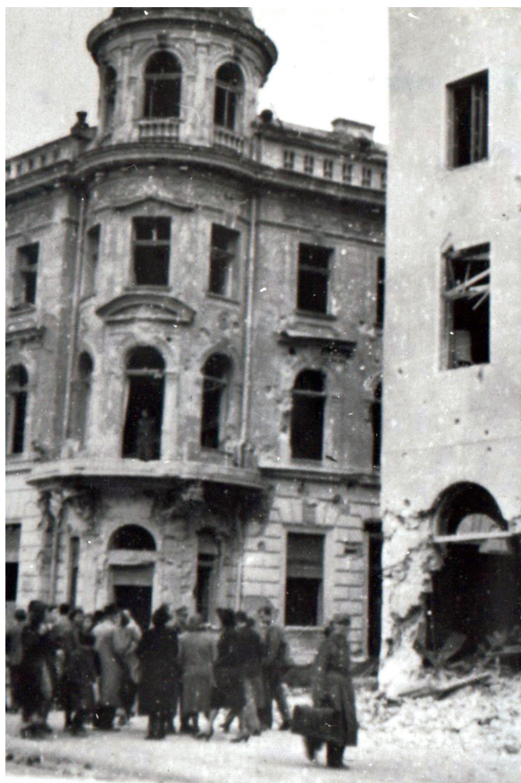
Slika 9 – Stambena zgrada prekoputa Domobranske bolnice, vazdušni napad 1944. godine.

kapitalističkih i komunističkih terorista. 87 Pojačavajući negativan naboj prema neprijatelju, Novi list insistira da su “neprijateljski zrakoplovci najveći dio svog smrtonosnog tereta ponovno bacili nasumice, sijući u raznim gradskim četvrtima smrt, užas i ruševine” te isključivo tematizira stradanje malog čovjeka i njegove teške sudbine. Stoga su kao najveće žrtve bombardovanja akcentovani stanovnici sarajevskih ulica nastanjenih “najvećim dielom malim službenicima i ostalim sitnim svijetom.” 88