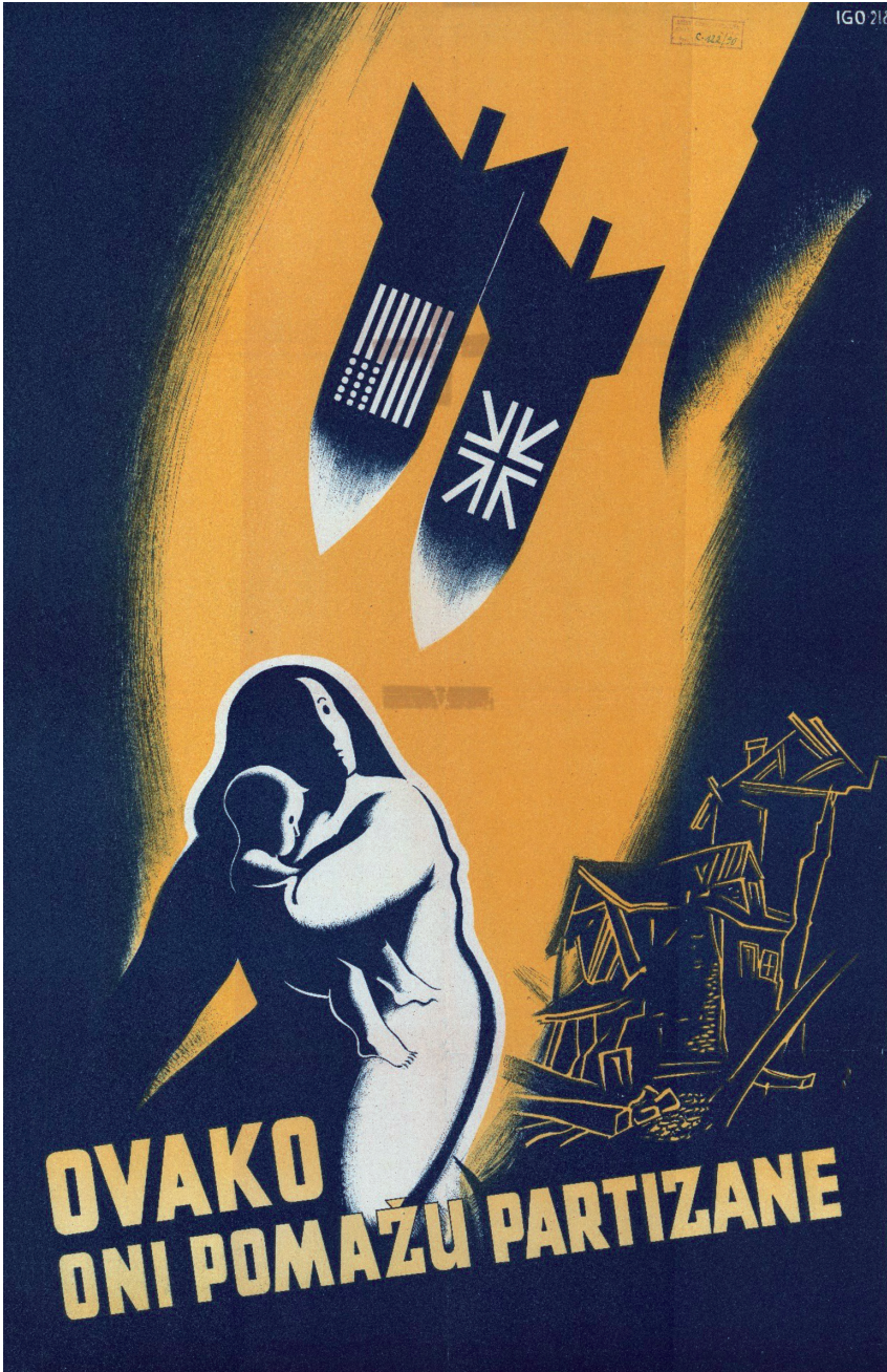
Slika 3 - Plakat.