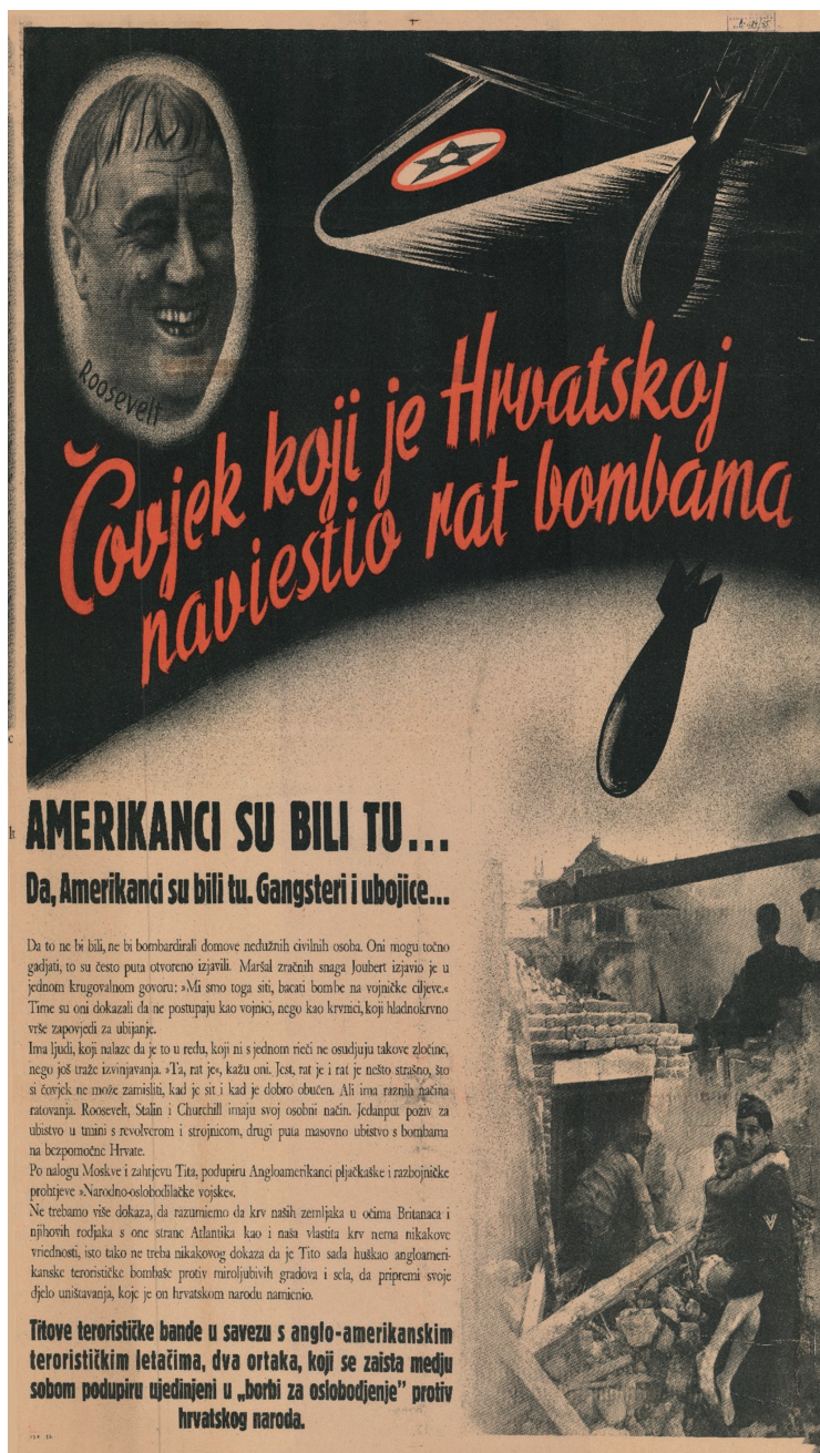
Slika 4 - Plakat.