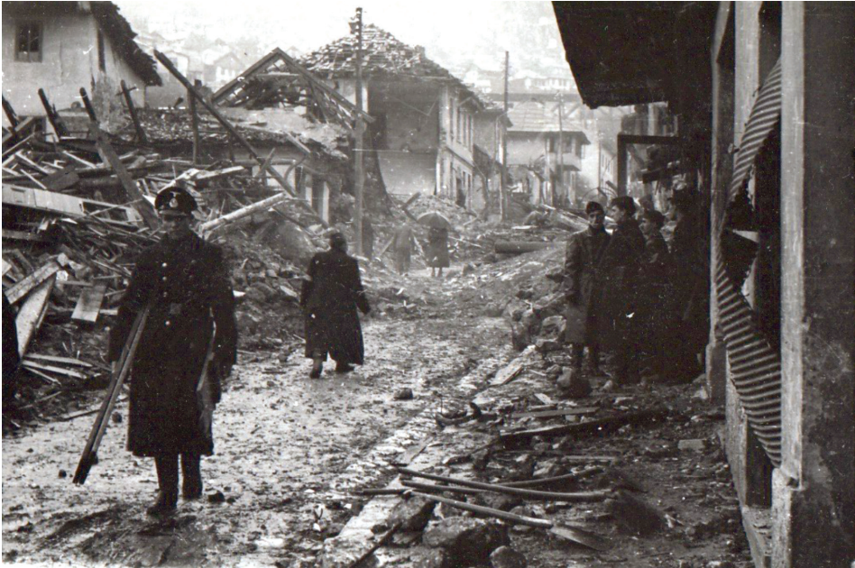
Slika 1 – Bistričica, vazdušni napad iz novembra 1943. godine. Izvor: Historijski muzej Bosne i Hercegovine, Fond: Zbirka fotografija (dalje: ZF), inventarni broj: FNOB 5902.

Ispod ruševina uništenih i oštećenih kuća izvučeno je oko 130 tijela. Zbog razorne moći bombi znatan broj njih je bio toliko unakažen da su ostali neidentifikovani (57). Prilikom bombardovanja ranjeno je oko 150 lica. Do kasno u noć pripadnici Narodne zaštite radili su na izvlačenju ranjenih iz ruševina. Ranjenicima je ukazivana najnužnija medicinska pomoć na licu mjesta, nakon čega su svi upućeni u Državnu bolnicu radi temeljitog ljekarskog pregleda. U narednih desetak dana nastavilo se s otkopavanjem ruševina i iskopavanjem mrtvih, evidentiranjem poginulih i ranjenih, raščišćavanjem puteva, rušenjem pojedinih dijelova razorenih kuća kojima je prijetila opasnost obrušavanja te prijavljivanjem materijalne štete nastale na privatnim objektima. 20 O bacanju bombi na dio grada gusto naseljen sirotinjom i stradanju civila lokalni Novi list je pisao kao o